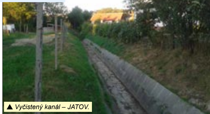
▲ Vyčistený kanál – JATOV.