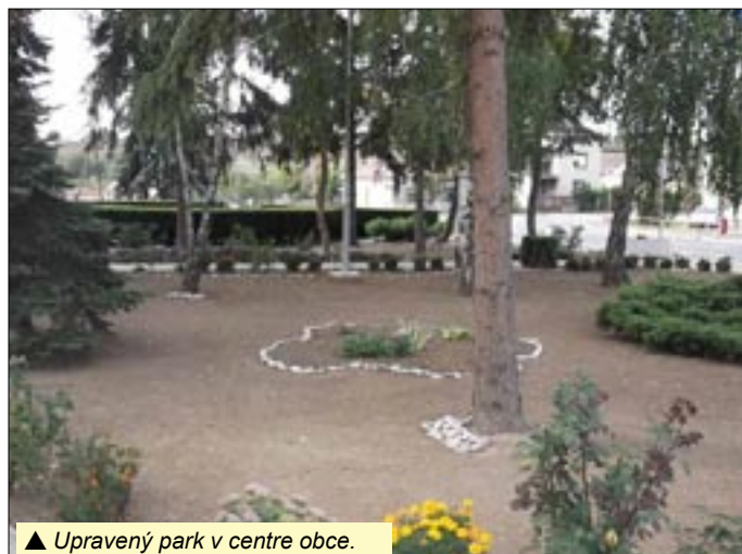
▲ Upravený park v centre obce.