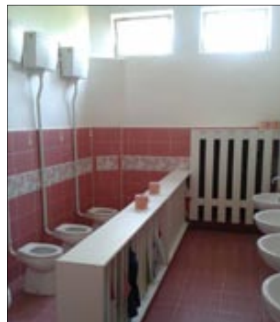
▲ Zrekonštruované hygienické zariadenia v Materskej škole.

Od septembra sme začali s rekonštrukciou autobusových zastávok. Úspešne sme zrekonštruovali 4 zastávky, z toho 3 zastávky v centre obce a jednu na Osadách. V nasledujúcom období zrekonštruujeme zastávku pri Základnej škole a v Kotle. Výstavba a rekonštrukcia autobusových zastávok – čakárni bola realizovaná svojpomocne za účasti aktívnych zamestnancov, za-