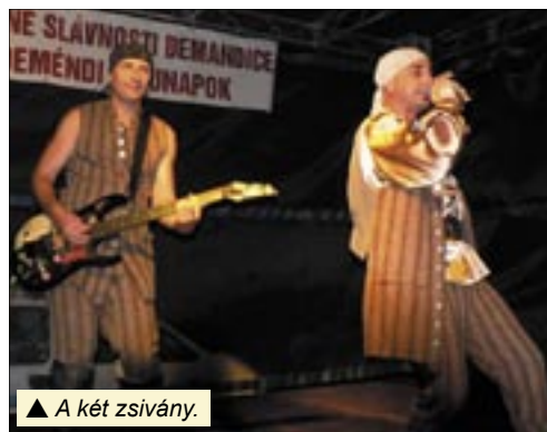
▲ A két zsvány.