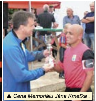
▲ Cena Memoriálu Jána Kmetka .