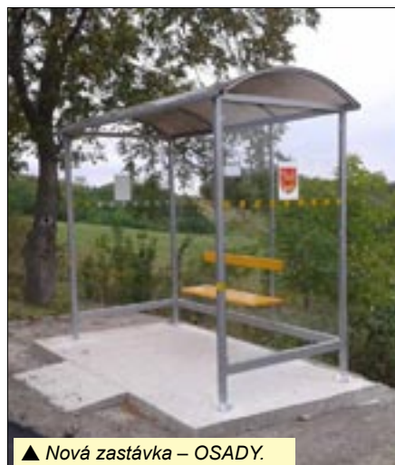
▲ Nová zastávka – OSADY.