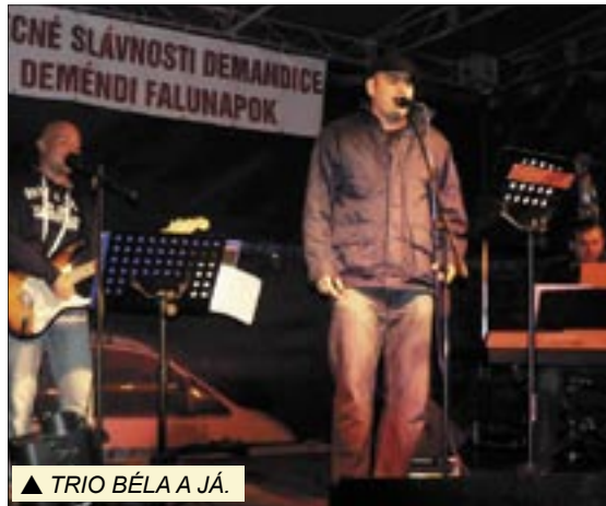
▲ TRIO BÉLA A JÁ.